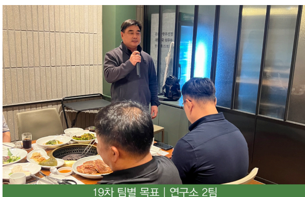
19차 팀별 목표 | 연구소 2팀