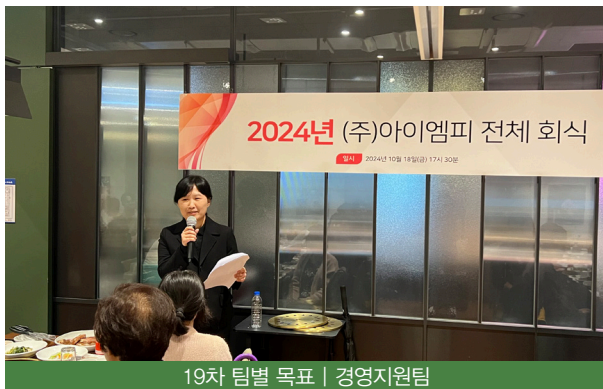
19차 팀별 목표 | 경영지원팀