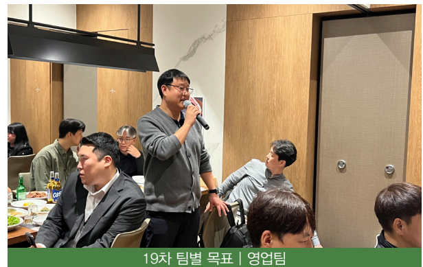
19차 팀별 목표 | 영업팀