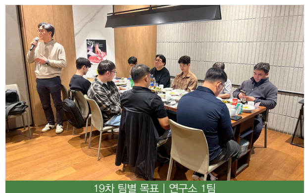
19차 팀별 목표 | 연구소 1팀