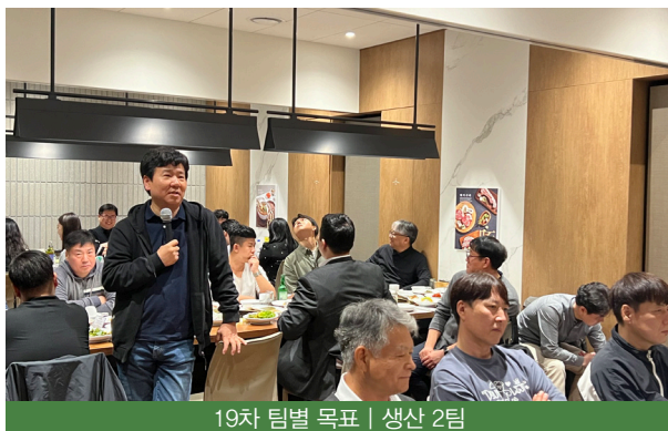
19차 팀별 목표 | 생산 2팀