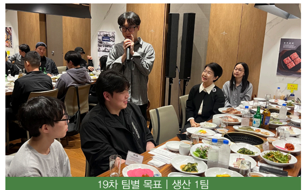
19차 팀별 목표 | 생산 1팀