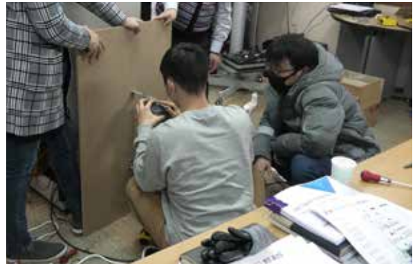
스피커 설치 실습