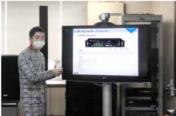
제품 이론 교육

금번 1회차는 교육인원이 마감되어 다음회차 교육에 대한 문의는 영업팀(02-3494-2333)으로 부탁드립니다.